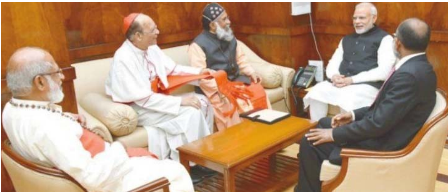
പ്രധാനമന്ത്രി നരേന്ദ്ര മോദിയെ പാർലമെന്റിലെ ഓഫീസിൽ സന്ദർശിച്ചു ചർച്ച നടത്തുന്ന സീറോ മലബാർ സഭ മേജർ ആർച്ച്ബിഷപ്പ് കർദിനാൾ മാർ ജോർജ്ജ് ആലഞ്ചേരി, ലത്തീൻ കത്തോലിക്കാ മെത്രാൻ സമിതി പ്രസിഡന്റ് കർദിനാൾ ഓസ്വാൾഡ് ഗ്രേഷ്യസ്, സിബിസിഐ പ്രസിഡന്റ് കർദിനാൾ മാർ ബസേലിയോസ് ക്ലീമിസ് കാതോലിക്കാബാവ എൻ. ബിജെപി ദേശീയ നിർവാഹക സമിതി അംഗം അൽഫോൻസ് കണ്ണത്താനം സമീപം.