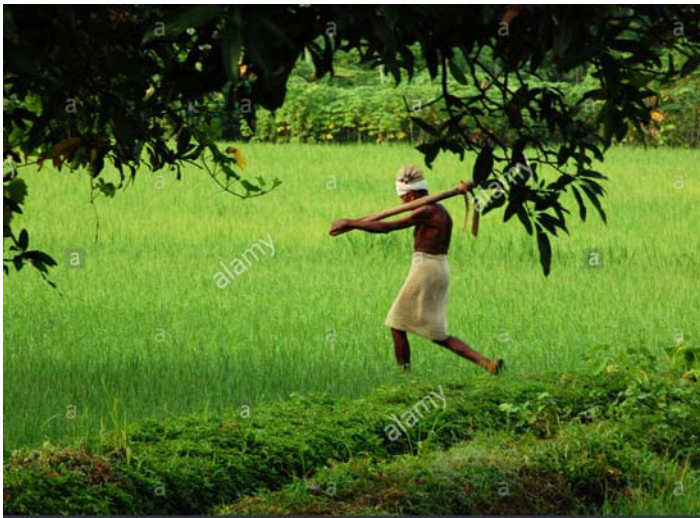
റ്റുമുള്ള ജനങ്ങളുടെ ജീവിതക്കണ്ണിരും നേരിട്ടറിഞ്ഞ് അനുഭവിക്കണം.

ഉമ്മൻ റിപ്പോർട്ടുപ്രകാരം യുപിഎ ഇറക്കിയ കരടുവിജ്ഞാപനം അനുസരിച്ച് അന്തിമവിജ്ഞാപനം ഇറക്കിയാൽ 22 ലക്ഷത്തോളം ജനങ്ങൾ പശ്ചിമഘട്ടത്തിന് കൂടിയിറക്കപ്പെടും. ഇതിന്റെ വാസ്തവമറിയാണമെങ്കിൽ മഹാരാഷ്ട്രയിലെ മഹാബലേശ്വരിലെ ജനങ്ങളുടെ ദുരിതവും, കർണ്ണാടകയിലെ ഹംബിയിലുണ്ടായ കൂടിയൊഴിപ്പിക്കലും, പരിസ്ഥിതിലോലമായ പ്രഖ്യാപിച്ച ഉത്തരാഖണ്ഡിലെ കോർബറ്റ് നാഷണൽ പാർക്കിനുമു